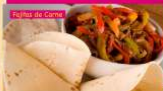
Fajitas de Carne

Rodízio + Refrigerante + Sobremesa à vontade para duas pessoas.